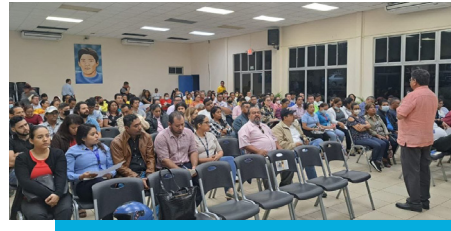
Figura 4 Capacitación realizada con personal de la UNAN-Managua

Nota. La imagen refiere la participación de personal de la UNAN-Managua durante el proceso de capacitación.