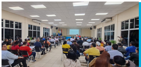
Figura 3 Encuentro para sensibilización al personal de la UNAN-Managua

Nota. En la imagen se muestra un encuentro que se sostuvo con personal de la UNAN-Managua.