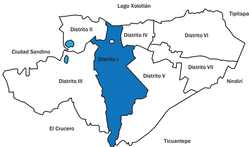
Mapa del Distrito 1, municipio de Managua

Nota. En la figura se indica el área geográfica del Distrito 1.