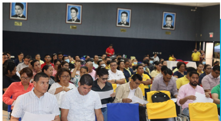
Figura 5 Capacitación a la comunidad universitaria de la UNAN-Managua

Nota. En la imagen se observa uno de los encuentros dentro del plan de capacitación al personal de la UNAN-Managua.