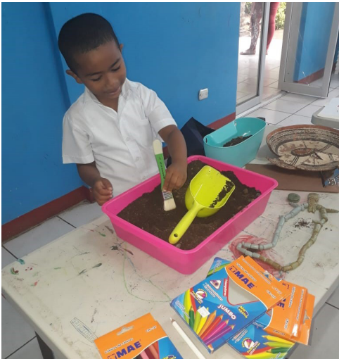
Figura 4. Niño del CDI Luis Alfonso Velásquez Flores, de San Juan del Sur, Rivas, realizando excavación arqueológica con brocha. Fuente: Ivonne Miranda Tapia. Agosto 2018.

Posteriormente se les entregué otras hojas con dos diseños diferentes que reproducían petro grabados que representan un jaguar y un mono (correspondientes a petro grabados originales del pacífico de Nicaragua). Como parte de la actividad los niños/as debían reproducir estas figuras utilizando color amarillo y café guiándose por los surcos de los Petro grabados representados en los dibujos. (Fig. 2)