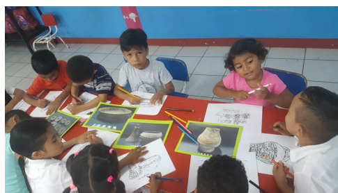
Figura 1. Niños y niñas del CDI Luis Alfonso Velásquez Flores, San Juan del Sur, Rivas, coloreando dibujos de piezas arqueológicas precolombinas del Pacífico de Nicaragua. Fuente: Ivonne Miranda Tapia. Agosto 2018.

Una de las primeras actividades consistió en distribuirles en sus mesitas de clase hojas con dibujos de piezas cerámicas y líticas precolombinas locales que ello/as las colorearan. Para ello debían guiarse con fotografías de piezas originales en las que podían ver los patrones de dibujo y los colores de estas. (Fig. 1)