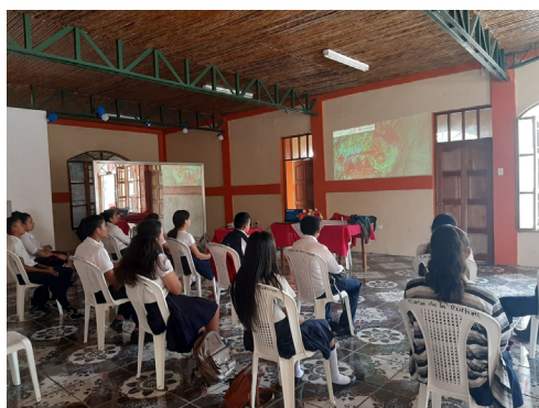
Figura 5. Presentación de videos sobre arte rupestre de la Laguna de Asososca, a jóvenes estudiantes de secundaria del Colegio Rubén Darío, San Dionisio, Matagalpa. Noviembre 2020.

Además de las diapositivas en datashow, a los jóvenes de secundaria y a universitarios también se les exhiben videos producidos por la propia Dirección de Nacional de Arqueología del INC, que demuestran la complejidad social y la cosmovisión de nuestros grupos originarios. Un buen ejemplo de esto es la inspección arqueológica desarrollada en los paredones de la laguna de Asososca, que presenta arte rupestre con pictografías de color rojo. Dado que el acceso a este sitio arqueológico ubicado en la capital está restringido por tratarse de la principal fuente de agua potable de la ciudad, esta es la única manera de posibilitar el “acercamiento” o una suerte de “visita virtual” de los jóvenes al sitio. (Fig. 5)