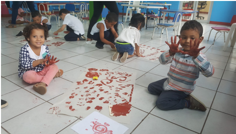
Figura 3. Niños del CDI Luis Alfonso Velásquez Flores, de San Juan del Sur, Rivas, realizando improntas con pintura roja en papelógrafo, simulando el arte rupestre precolombino nicaragüense. Agosto 2018.