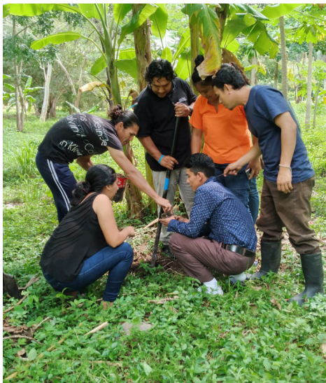
Figura 3 Estudiantes en sesión de clase práctica- Aprender haciendo

Nota: Estudiantes del IALA Iximulew durante clases de suelo desde la metodología CaC formando capacidades técnicas y dialógicas.