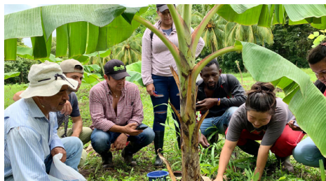
Figura 2 Estudiantes en sesión de clase práctica

Nota: Estudiantes del IALA Iximulew durante clases de suelo desde la metodología CaC.