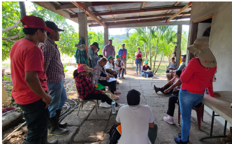
Intercambio entre estudiantes y campesinos

Nota: Estudiantes del IALA Iximulew durante un Intercambio de Campesino a Campesino en la Comunidad Tierra Blanca, Santo Tomás, Chontales.