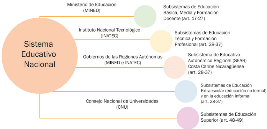
Figura 1 Sistema Educativo Nacional